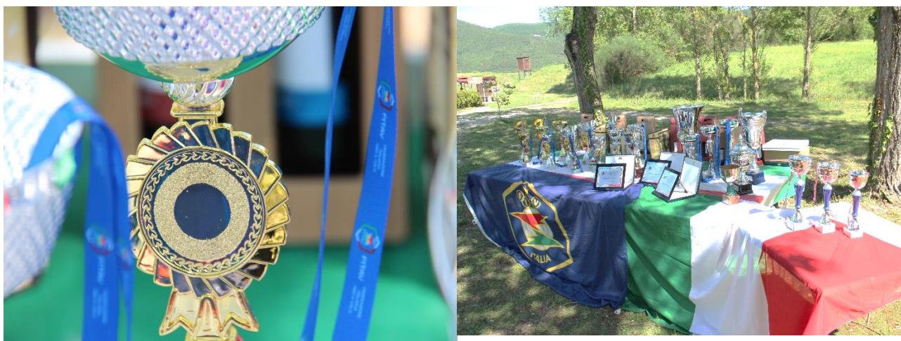
Specialità Fossa Olimpica a 100 Piattelli